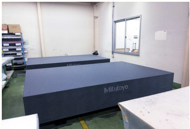
CFRP成形/測定用石定盤 2000×3000 2面