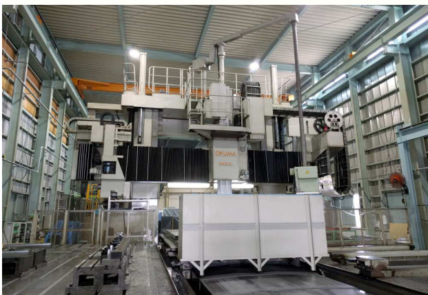
オークマ五面加工機 MCR-30E 5000×3050×2050