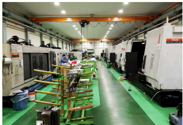
長尺縦マシニングセンター 5000×500 2台 3000×500 4台 2000×500 4台