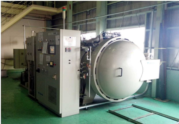
芦田オートクレーブ φ1200×4500L 最大炉内温度200℃